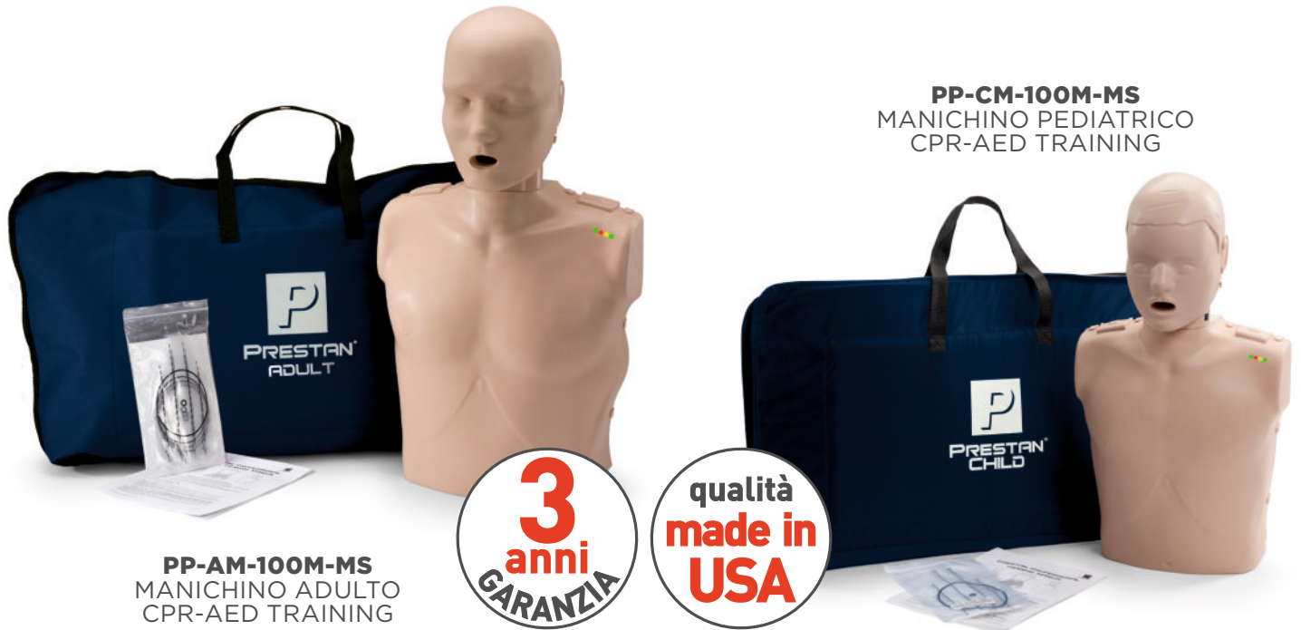
PP-AM-100M-MS MANICHINO ADULTO CPR-AED TRAINING